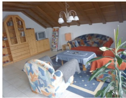
Wohnzimmer Sofa, Farb-TV