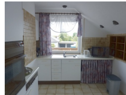
Küche komplett ausgestattet mit Geschirr, Töpfen, Elektroherd, Mikrowelle, Toaster, Kühlschrank, Kaffeemaschine, Wasserkocher